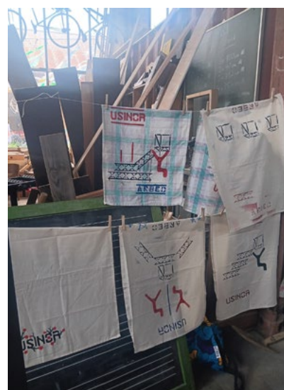
Atelier Torchon d'Usine - mai 2024 - CNCI

Opportunités : visibilité du CNCI. Lien avec les autres asbl de la Ville de Dudelange. Mise en valeur d'artistes du territoire transfrontalier en lien avec l'héritage industriel.