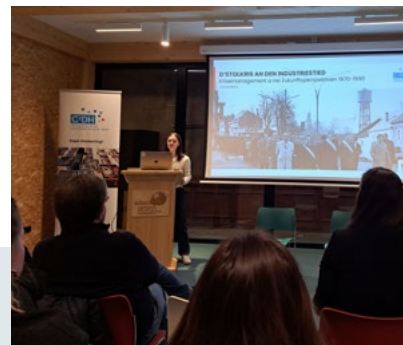
Conférence Historesch Gesinn - novembre 2024 - CNCI

Opportunités : collaborer avec 2 partenaires en l'occurrence l'EMC et Historesch Gesinn.