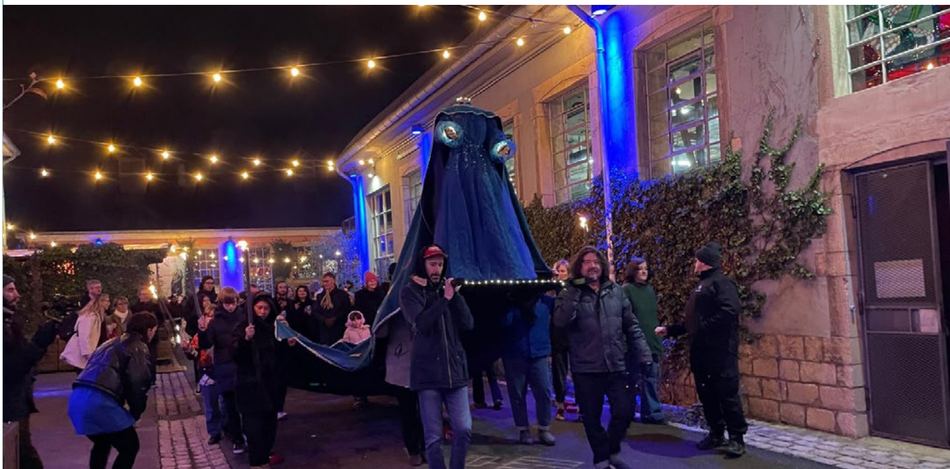
Grande Soirée Sainte Barbe - décembre 2024 - CNCI

Opportunités : le CNCI a bénéficié d'un espace et d'un temps pour redéployer certains de ses formats (Mini Buttek, Buffet Schmieren). C'était également l'occasion de faire découvrir une tradition (fanfare, buffet, procession) en intégrant des codes contemporains pour sensibiliser le public (bière brassée spéciale Sainte Barbe, ateliers tout public).