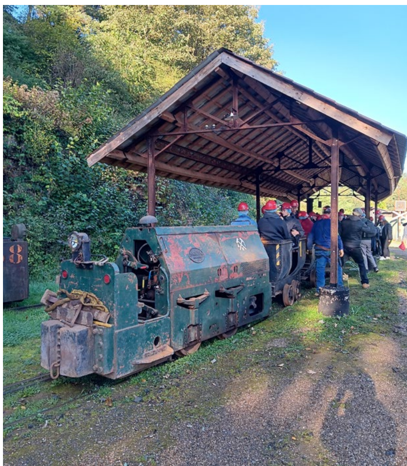
eXploration#1 - octobre 2024 - CNCI

Opportunités : cette eXploration a également permis de poser les bases de futures collaborations avec l'A.H.I. (Association d'Histoire Industrielle). Proposer un événement unique et renforcer nos partenariats.