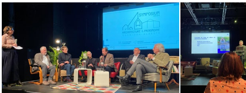
Forum, architecture & patrimoine - novembre 2024 - CNCI