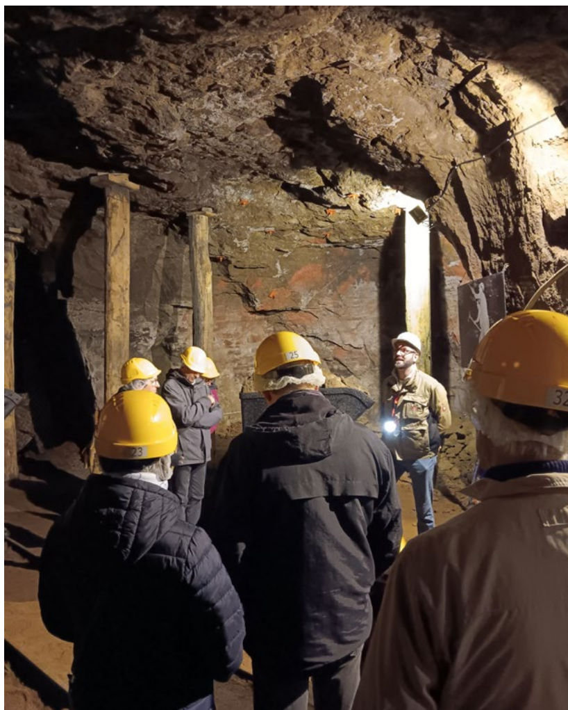
Sur les traces du Minett - septembre 2024 - CNCI

Opportunités : le CNCI a bénéficié de la communication associée aux JEP. Cet événement a permis de renforcer le lien du CNCI avec trois partenaires différents.