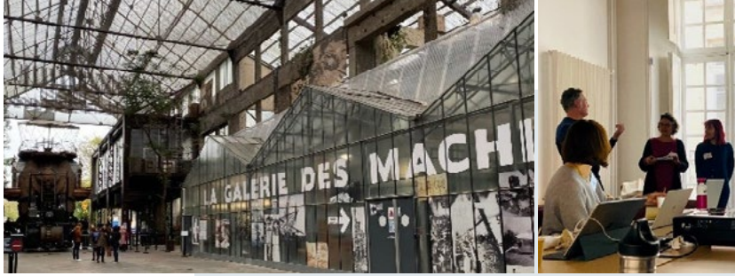
European Heritage Lab, Nantes - novembre 2024 - CNCI © CNCI - Centre national de la culture industrielle