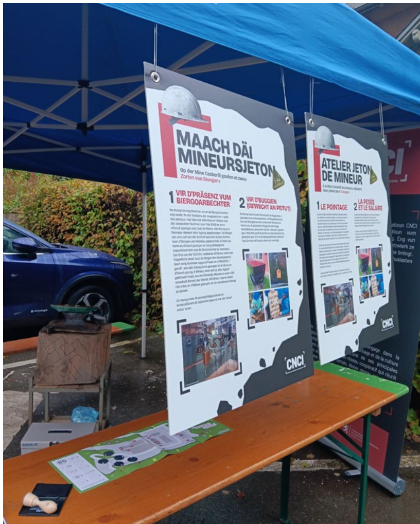
Atelier Jeton de mineur - Minett Treasure - octobre 2024 - CNCI

Opportunités : intégrer la programmation d'un autre partenaire, marquant ainsi notre place essentielle dans le réseau industriel en proposant deux initiatives : L'Atelier Jeton qui concluait le parcours des enfants et la Mini Buttek qui met en avant les initiatives créatives de nos partenaires.