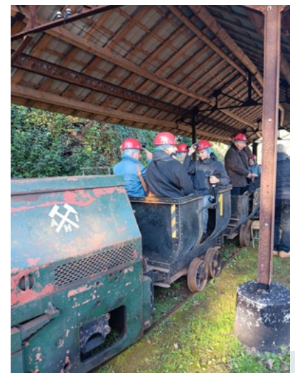
eXploration#1 – octobre 2024 – CNCl

Ces rencontres ont permis de renforcer l'engagement du CNCl auprès du public sénior et de le sensibiliser aux missions de l'asbl. L'inclusion sociale est essentielle pour que le patrimoine industriel soit perçu comme un bien commun et assurer une transmission transgénérationnelle .