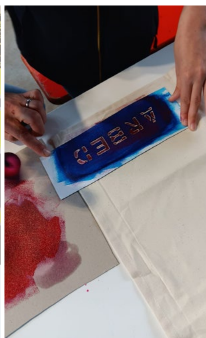
Atelier Torchon d'Usine - mai 2024 - CNCI