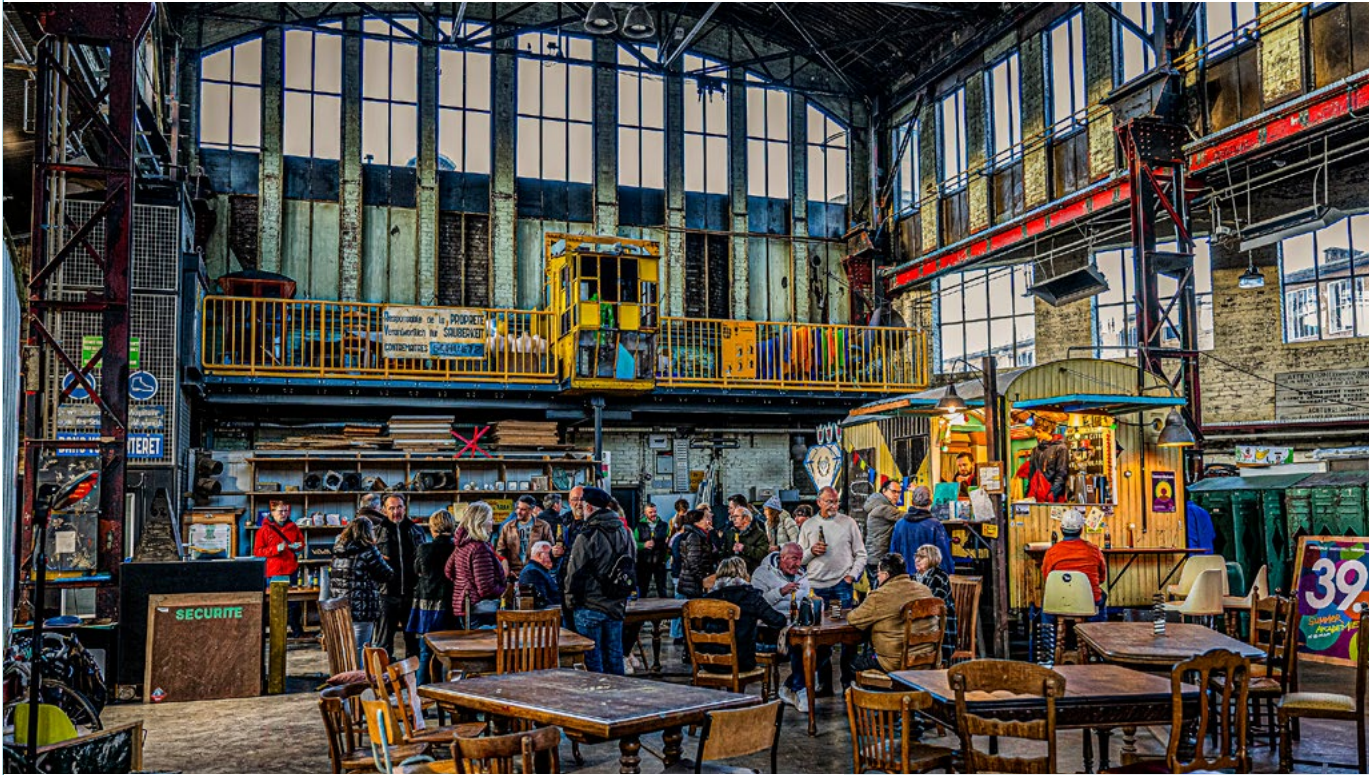
Projection L'Usine secrète - mars 2024 - CNCI

Opportunités : collaboration avec deux partenaires : le CNA et VeWa. La communication a été assurée par le CNCI, incluant le suivi avec le CNA, la gestion des réseaux sociaux, et la préparation du programme de salle.