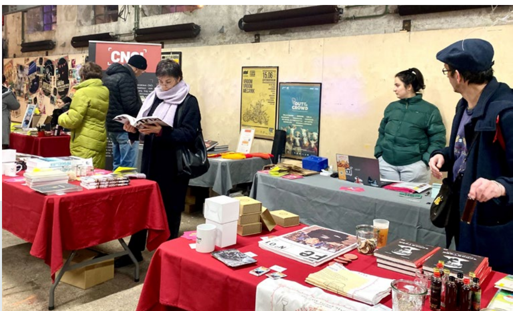
Mini Buttek à la Kufa-Ste Barbe

Que ce soit en binôme avec la chargée des archives ou la responsable pédagogie, les partenaires ont été sollicités, mobilisés, les collaborations plurielles. (Cf. page 34 - Programme 2024) Cette année, la création de la Mini Buttek a été un outil de mise en valeur de nos partenaires mais aussi pour le CNCl le rôle de fédérateur. Ces 3 petits marchés ont eu lieu en janvier à la Korschthal, octobre lors du Minett Treasures (Ellergronn) organisé par l'ORT et décembre à la Kufa (Soirée Ste Barbe). Sur les 14 partenaires qui nous confient leurs produits à vendre, 8 sont nos partenaires historiques . En totalité, le CNCl a vendu pour 1047€ de marchandises de tous nos partenaires confondus lors de ces 3 Mini Buttek.