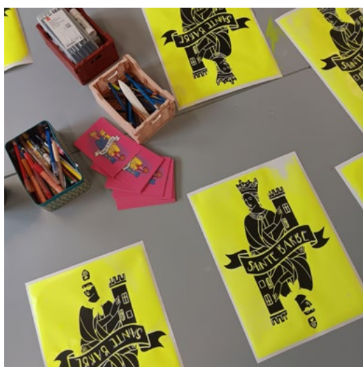
Atelier Fanzine - décembre 2024 - CNCI

L'objectif de ces actions est de rendre l'héritage industriel vivant et accessible au plus grand nombre, tout en valorisant les aspects techniques, sociaux et économiques de cet héritage.