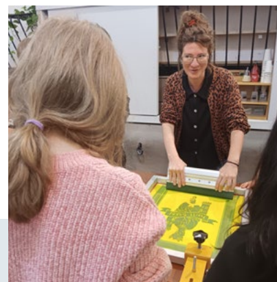
Atelier Fanzine - décembre 2024 - CNCI

Opportunités : nouer des liens avec l'Harmonie des mineurs qui est intéressée pour collaborer avec le CNCI à une prochaine édition de la Sainte Barbe.