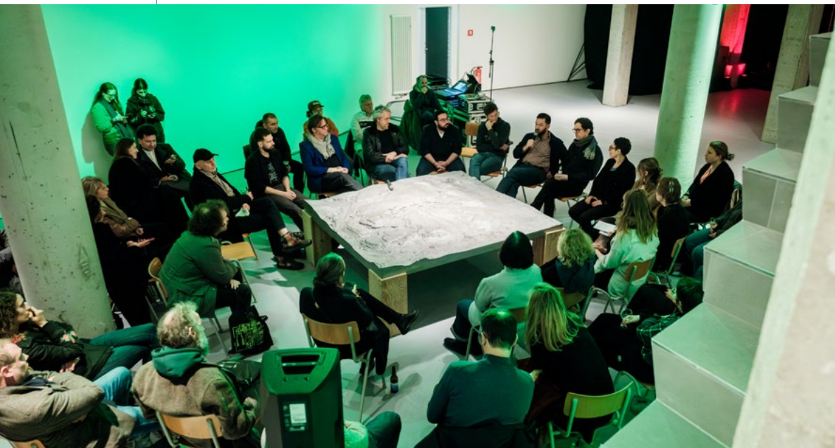
Korschthal Esch, Takeover Thursday – La Fabrique à mémoire, 2024

Réunir ces personnes n'a pas été simple : autant les intervenants ont accepté rapidement, autant il a fallu convaincre la direction de la Korschthal que ce mélange serait pertinent, cohérent. Au final, la soirée fut un succès, du jamais vu pour l'établissement d'accueil lors d'un Takeover Thursday (150 personnes présentes au lieu des 100 maximum espérées).