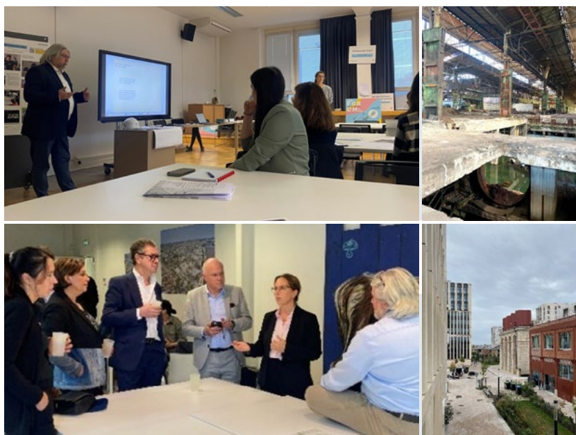
Metzschmelz étude de vocation - juillet à décembre 2024 - CNCI © CNCI - Centre national de la culture industrielle

La collaboration avec AGORA progresse et les échanges avec les institutions locales sont constructifs. Le CNCI a été reconnu comme consultant officiel en patrimoine industriel et sera intégré au processus de planification. Une approche globale et des partenariats renforcés sont essentiels pour assurer une réaffectation durable du site.