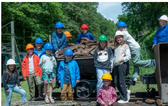
Mini Schmelz - juillet 2024 - CNCI