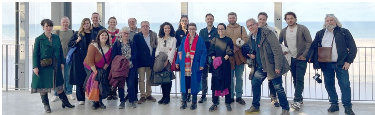
Voyage d'études - Dunkerque - CNCI