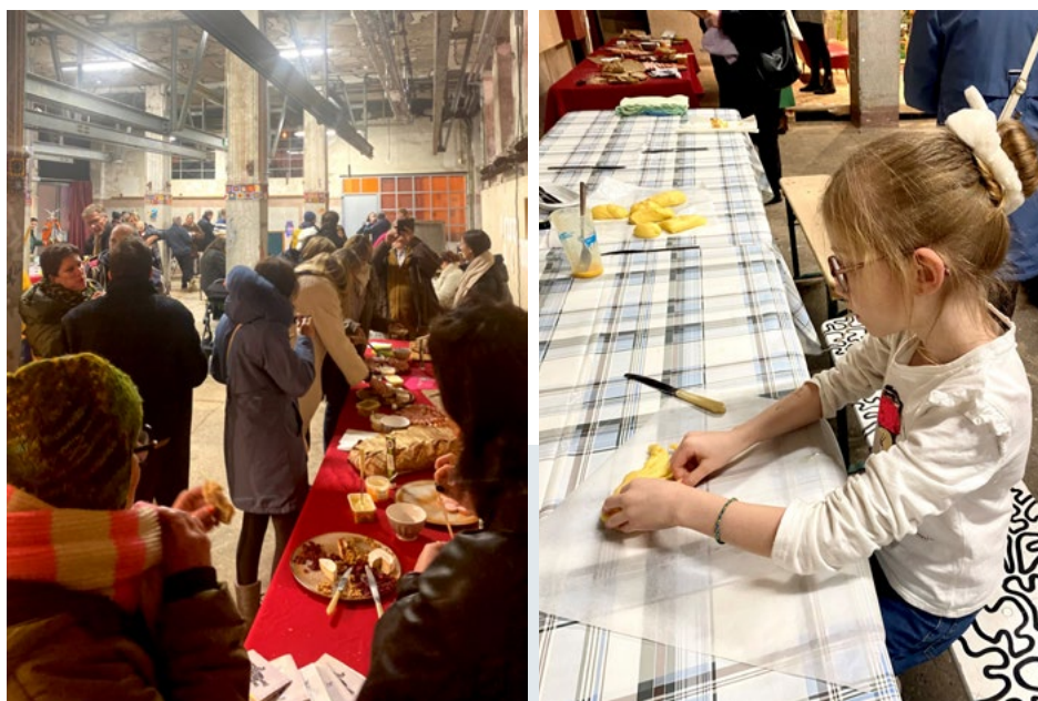
Grande Soirée Sainte Barbe - décembre 2024 - CNCI © CNCI - Centre national de la culture industrielle

Le programme pédagogique du CNCI permet également de mettre en avant ses partenaires . Lors du Minett Treasure , le CNCI a proposé un atelier Jeton de mineur , en lien avec le site minier, notamment valorisé par l' Entente Mine Cockerill . Cet événement a été l'occasion au CNCI et à l'EMC d'échanger leurs compétences : le CNCI a bénéficié des outils et du matériel fournis par l'EMC, tandis que le CNCI a financé un panneau de médiation pour le musée, permettant désormais à l'EMC de proposer cet atelier à son public.