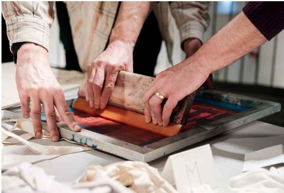
Konschthal Esch, Takeover Thursday – La Fabrique à mémoire, 2024